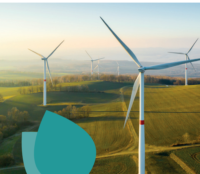
Podíl na trhu - fondy dle článku 8* a 9* klasifikace SFDR***

Na výkonnost amerických akcií měl největší vliv environmentální přístup (E – environmental). V Evropě to bylo naopak řízení společností (G – governance). V posledních letech jsme svědky toho, že na důležitosti nabývají i sociální aspekty (S – social).